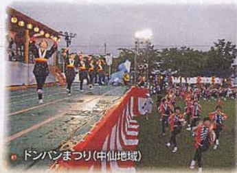
ドンバンまつり(中仙地域)