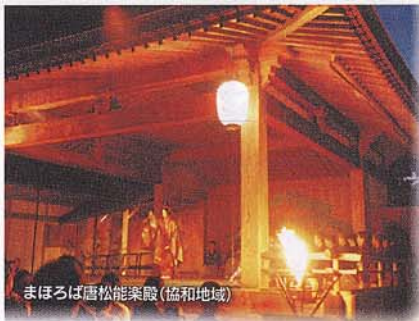
まほろば唐松能楽殿(協和地域)