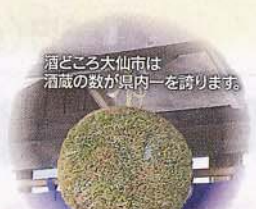
酒どころ大仙市は酒蔵の数が県内一を誇ります。