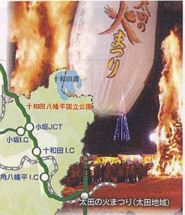
太田の火まつり(太田地域)