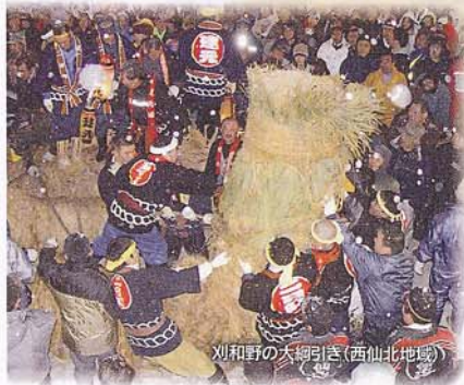
刈野の大綱引き(西仙北地域)