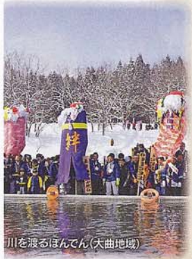
川を渡るほんでん(大曲地域)