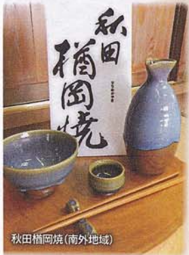
秋田櫛岡焼(南外地域)