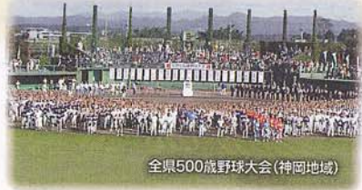
全県500歳野球大会(神岡地域)