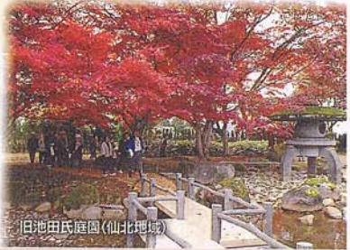
旧池田氏庭園(仙北地域)